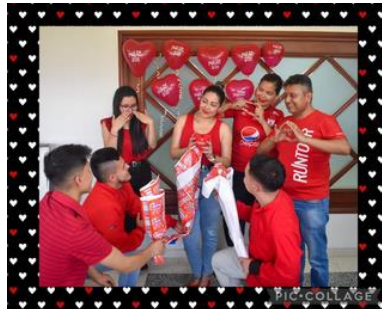
4to puesto Planta 2