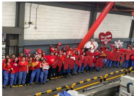
1er puesto- Sellado Planta 1

Las áreas que obtuvieron el 1er y 2do lugar recibieron un bono en efectivo para compartir en equipo, mientras que las demás áreas fueron reconocidas por su esfuerzo y participación con entradas dobles a Cine Colombia.