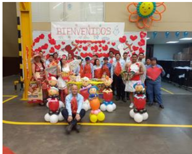
3er puesto Planta 3