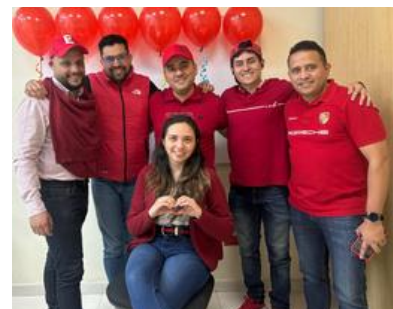
5to puesto Planta 1