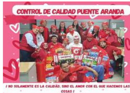
2do puesto- Calidad Planta 1