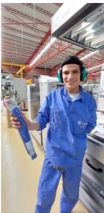
Foto Planta 2

Continuamos celebrando el cumpleaños de nuestros trabajadores(as) con un obsequio especial, agradeciendo su valiosa dedicación y contribución a Flexo Spring.